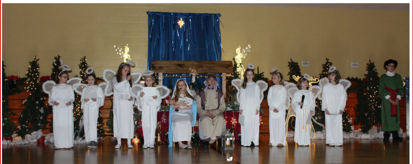
Jubileusz 30-lecia Polskiej Szkoły im. Władysława Reymonta w Bayonne, NJ