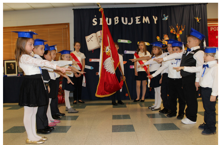
Jubileusz 30-lecia Polskiej Szkoły im. Władysława Reymonta w Bayonne, NJ