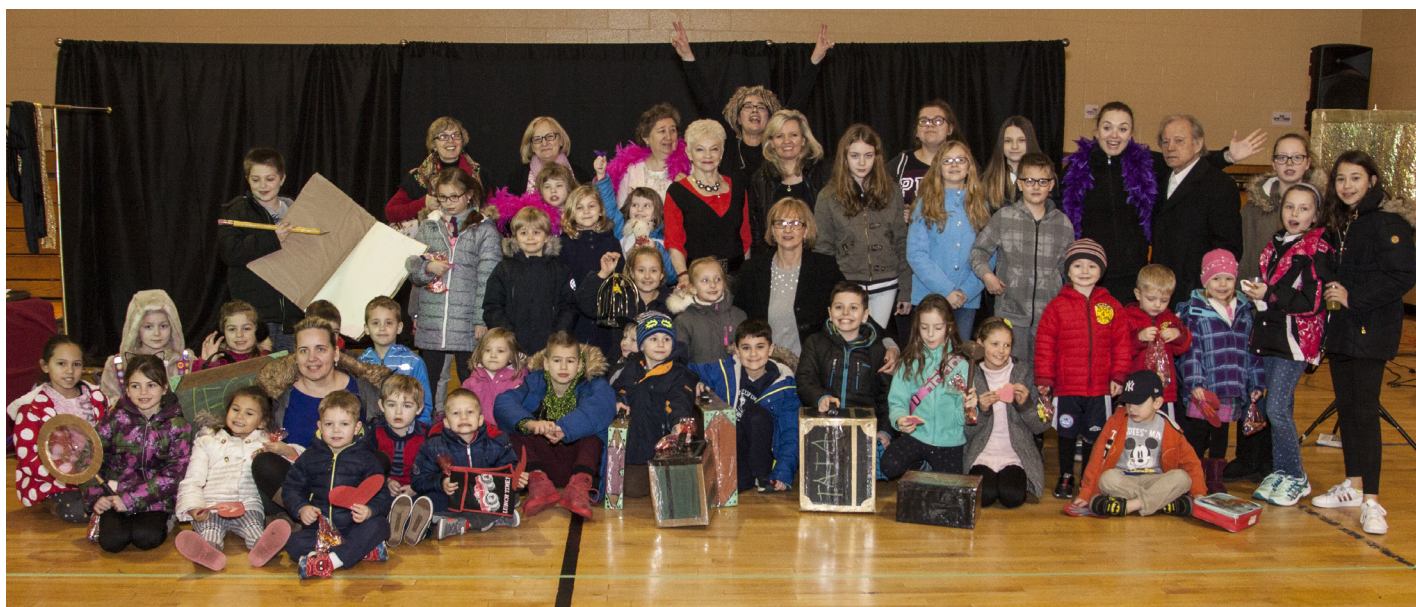
Jubileusz 30-lecia Polskiej Szkoły im. Władysława Reymonta w Bayonne, NJ