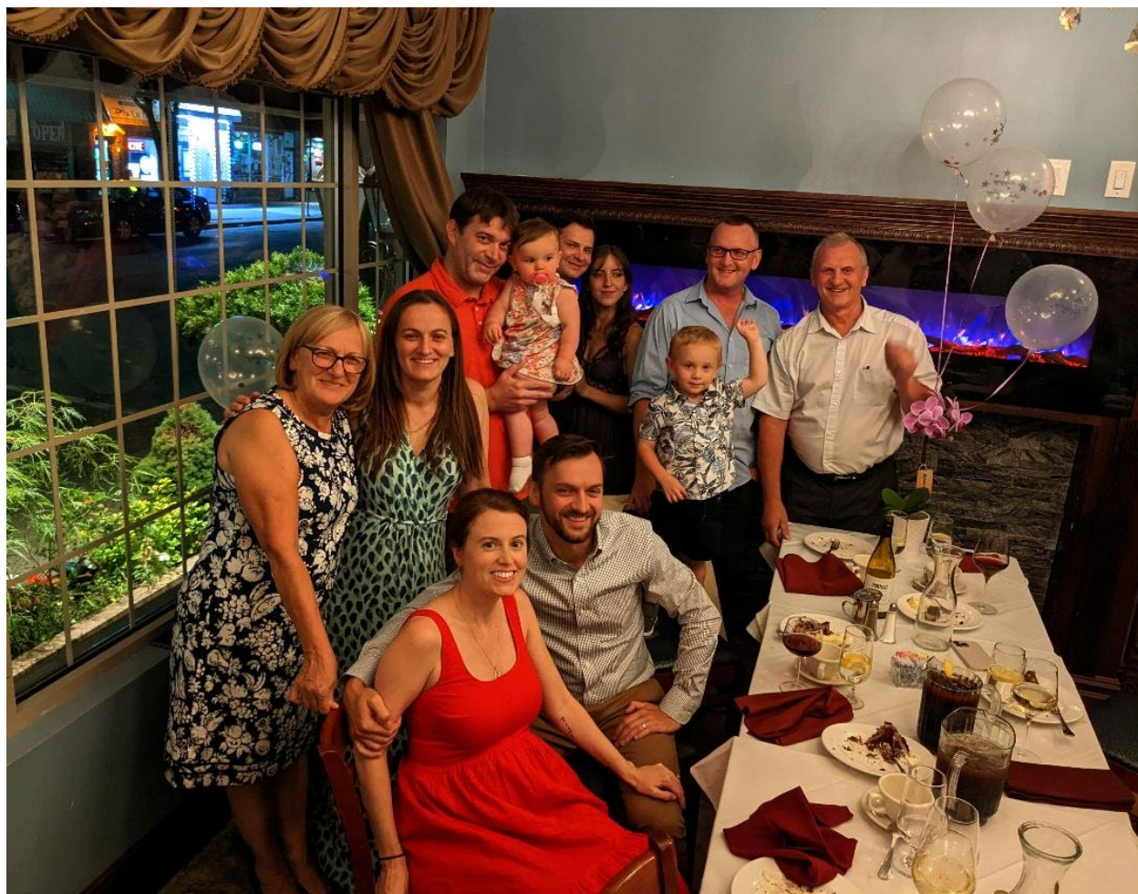
Jubileusz 30-lecia Polskiej Szkoły im. Władysława Reymonta w Bayonne, NJ