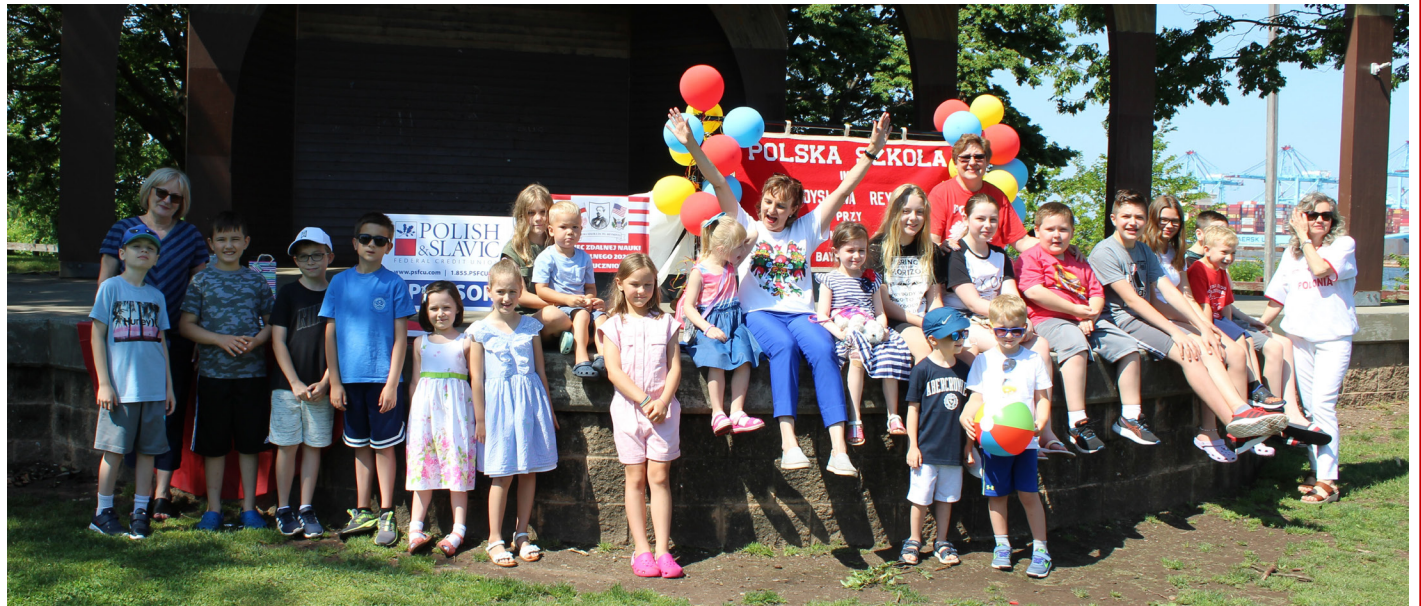
Jubileusz 30-lecia Polskiej Szkoły im. Władysława Reymonta w Bayonne, NJ